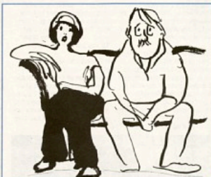
Overalt spores trøthed over at skulle igennem hele Unionsafstemningen en gang til. Bliver det et ja, skal der stemmes om yderligere udbygning af Unionen i 1996.

alle medlemsstater. Alt andet ville jo også være udemokratisk - det er jo ikke bananrepublikker, vi samarbejder med.