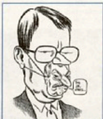
FORNYELSE - hedder tegneren Klaus Albrechtsens kommentar til valgkampen.

Naturligtvis vil de andre lande acceptere et nej. Faktisk er de tvunget til det. EFs egen grundlov, Romtraktaten, siger, at en ændring af EF kræver et ja fra