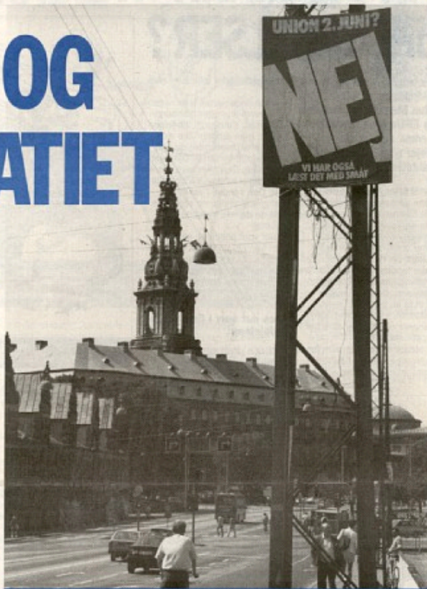
CHRISTIANSBORG: Det vil være vigtigere for os, hvem der er ved magten i Bonn, Paris og London end i København. Det har vi blot ingen indfyldelse på. Danske vælgere vil kun kunne udskifte tre ud af 76 stemmer i Unionens Ministerråd og 16 ud af 567 medlemmer af Unionens parlament.

● Unionen vil efterhånden tømme de enkelt medlemslande for politisk indhold. Alt - undtagen kirkepolitik - er med i Unionen - det gælder industripolitik, forbrugerpolitik, udlændingspolitik, sundhed, kultur, uddannelse, transport og telekommunikation. Traktaten er spækket med gummiparagrafer, der kan bruges til at udvide Unionens magt. EF-Domstolen bliver til Unionens domstol, der kan udstede bød og tilsidesætte folkevalgte beslutninger. Reelt ender det med nedlæggelse af folkestyret i nationalstaterne.