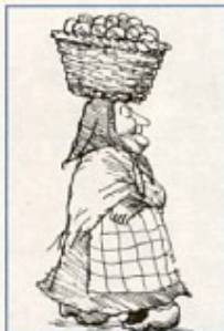
Som i eventyret om kønen med æggene, kom de danske forhandlere fra Edinburgh med ringe resultat.