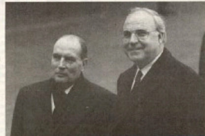
Kohl og Mitterrand påstår, at de vil gå videre uanset folk stemmer nej. Men også på hjemmefronten kniber det gevaldigt med opbakningen til det.

«Det vi har brug for, er tid til at stoppe op og spørge: Hvor er denne organisation løbet fra sig selv? Hvor kan den demokratiseres? I stedet for tøjlesløst at styrte videre med flere og flere gruppeportrætter...»