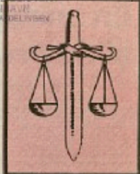
Før retfærdighed og ligetret!