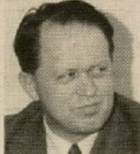
Ole Fygeskræm - Nordjyllands amt.

Socialdemokratiet - også et forslag om at fjerne den særlige landbrugsstatsteori i forbindelse med den økonomiske grundskyld er blevet stemt ned.