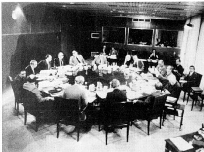
EF-Kommissionens møgt skal begrænses. Det skal være de folkevalgte politikere, der fremsætter forslagene. Ikke embedsmændene i EF-Kommissionen, der her ses under et møde.

ring fik blot nogle få parenteser indføjet.