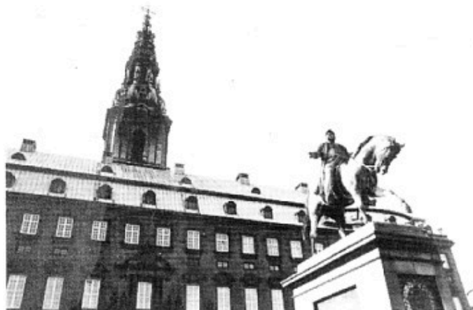
Folketinget vil ved et ja den 18. maj blive omdannet til et rent ekspeditionskontor for EF. Også derfor skal der stemmes nej.

Fremskridtspartiet ønsker STOP for udividelse af EF-budgettet.